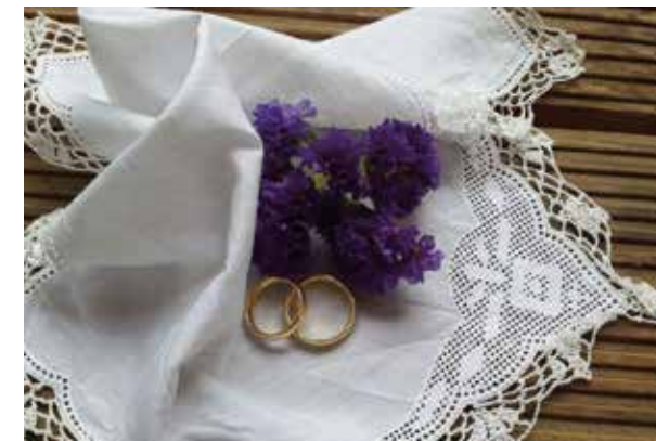
Foto: Die Ringe warten auf ihren Einsatz...