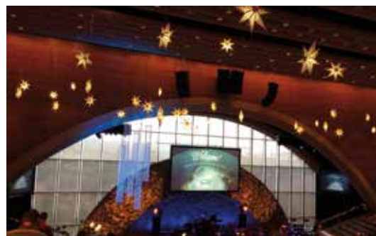
Gottesdienstsaal, Riverbend Church, Austin, Texas.

Dort angekommen war der riesige Saal, in dem alles stattfand, kaum zu übersehen. Dennoch richtete sich mein Augenmerk sofort auf einen kleineren Raum, da ich viele Leute mit Kaffeebechern dort herauskommen sah. Immer dem Kaffeegeruch nach kam ich in einen kleinen, sehr schönen Raum. Hier wurde nicht nur Kaffee in allen denkbaren Variationen verkauft, sondern auch Frühstück. Ich bestellte mir einen „Latte Macchiato Vanille, war mir aber dann nicht sicher, ob ich ihn wirklich mit in die Kirche nehmen dürfte. Man sagte mir: „Alles kein Problem! Dafür ist der Kaffee ja da! Du sollst Dich schließlich wohl fühlen in unserer Kirche!“ Wahrscheinlich war ich schon allein deshalb und von vornherein vollkommen überzeugt von dieser Gemeinde.