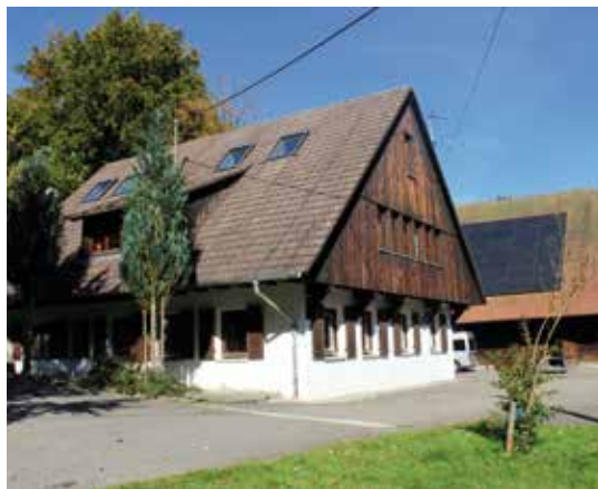
Haupthaus und Scheune: Im Sommer mit Platz für bis zu 80 Kinder und Jugendliche.

Seither konnten unzählige Gruppen mit Kindern und Jugendlichen, aber auch Familien mitten in der Hofstetter Natur unvergessliche Ferien- und Erholungstage verbringen. Viele Konfirmandeneltern berichten heute begeistert, wie sie vor Jahrzehnten selbst als Konfirmanden auf dem Fehrenbacherhof waren.