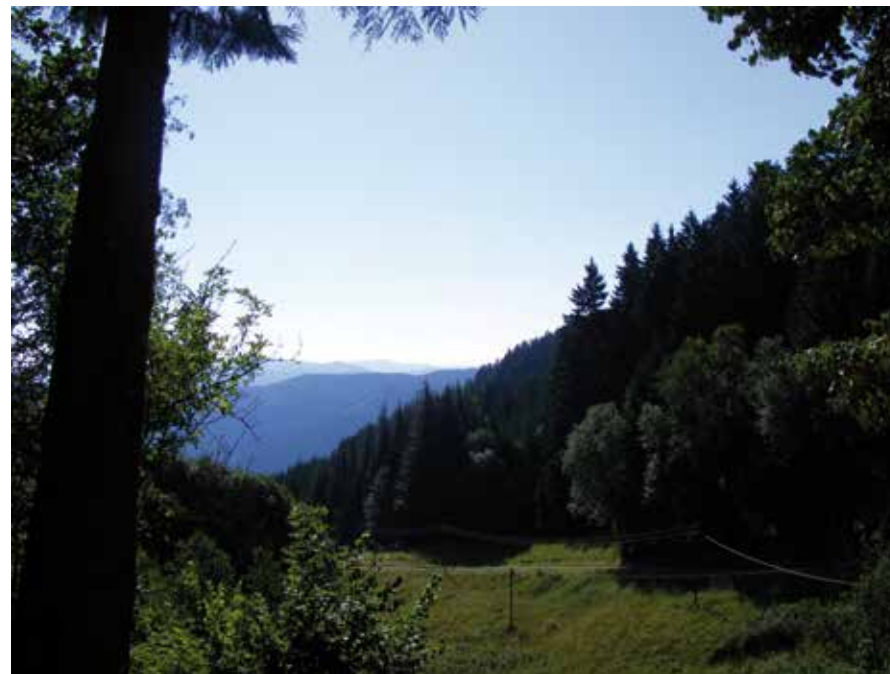
Mitten in Gottes Schöpfung...

Als allen Konfessionen und Religionen offen stehende Begegnungsstätte bietet der Fehrenbacherhof vor allem jungen Menschen eine preiswerte Gelegenheit,