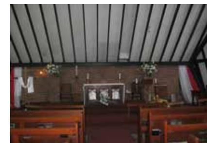
Innenraum der Kirche

Nach etwa 40 Minuten ist der Gottesdienst zu Ende und dann kommt es zu etwas, das ich und auch meine Freundinnen nicht erwartet haben: eine ältere Frau kommt mit einem freundlichen Lächeln auf uns zu, fragt uns nach unseren Namen und stellt sich selber vor. Sie ist sehr erfreut, uns hier zu sehen, stellt uns allen anderen Gottesdienstteilnehmern vor und lädt uns zum anschließendem Kaffee, Tee und Keksen im Nebengebäude ein. Wir verbringen dort noch eine gute Stunde, führen gute Gespräche mit den Anwesenden und sind