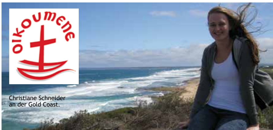
Christiane Schneider an der Gold Coast.

Quellen: de.wikipedia.org/wiki/Australien#Religion www.juedische-allgemeine.de/article/view/id/20194