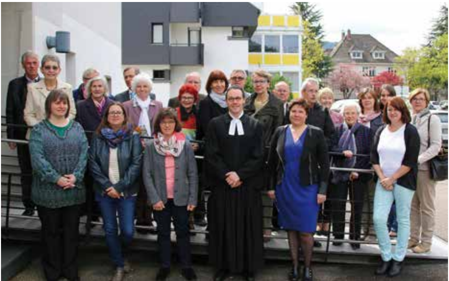
BU