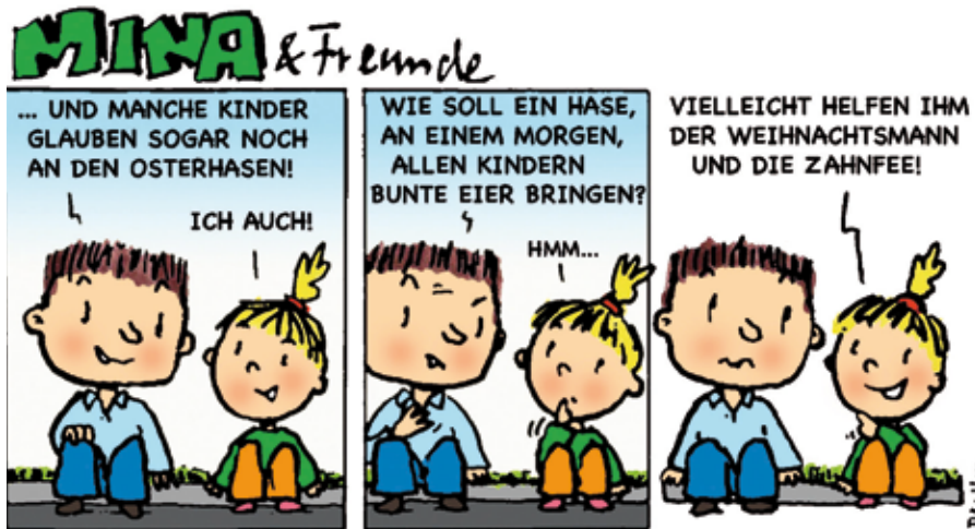
Cartoon: Gemeindebrief Evangelisch