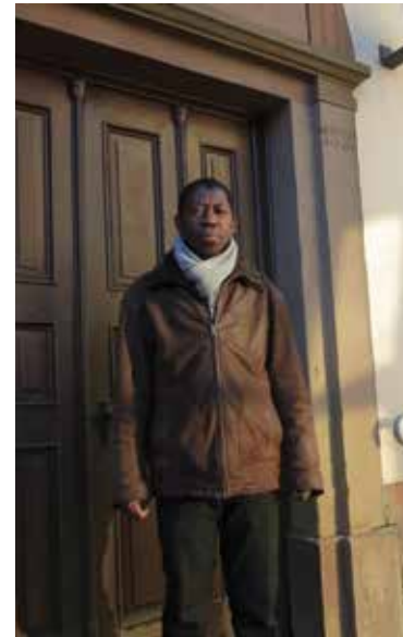
Links: „Monsieur Le Pasteur“ Agbenokoudj am Eingang der evangelischen Kirche von Ratzwiller (rechts).

Auch dieses Jahr stellen wir wieder eine Übersicht aller Angebote für Kinder und Familien in der Gemeinde zusammen. Wir stimmen gerade noch die letzten Termine mit den Fußballvereinen der Raumschaft Haslach ab, um Terminüberschneidungen zu vermeiden. Den Familien-Flyer schicken wir dann allen Familien mit Kindern von 0 bis 11 Jahren über die Schulen und Kindergärten oder per Post zu.