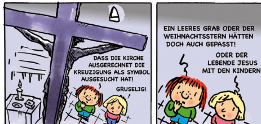
Cartoon: Gemeindebrief Evangelisch