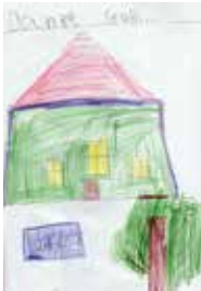
Noah Kienzler, Mühlen- bach

Fast 30 Kinder aus unserer Gemeinde nahmen im Religionsunterricht an der Malaktion zum Kirchenjahr teil. Thema der Bilder sind die Feste des Kirchenjahres. 12 Bilder zu Erntedank stellen wir hier vor. Danke an alle Kinder, Eltern und Lehrer, die mitgemacht haben.