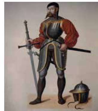
Graf Wilhelm von Fürstenberg (1491 – 1549)

Im Mai 1542 ließ Wilhelm von Fürstenberg eine evangelische Synode in Haslach abhalten – auf Wunsch der evangelischen Pfarrer der Landvogtei Ortenau und der Herrschaft Kinzigtal. Die Synode bat Graf Wilhelm, er möge eine Kirchenvisitation in beiden Gebieten durch den Straßburger