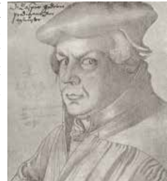
Der Reformator des Kinzigtals Dr. Caspar Hedio, Zeichnung von Hans Baldung Grien