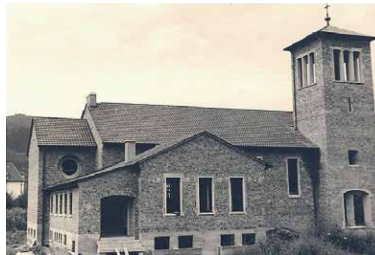
Der Rohbau der Kirche 1953