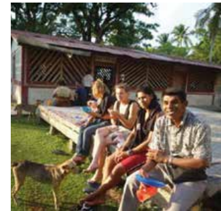
Freiwillige eines Projektes in Nicaragua.

Was tun nach Abitur oder Ausbildung? Jugendliche aus Baden zwischen 18 und 27 Jahren können über die Evangelische Kirche einen „Freiwilligen Ökumenischen Friedensdienst“ (FÖF) im Ausland leisten. Die Einsatzstellen liegen in Italien, Rumänien, Israel, Argentinien, Uruguay,