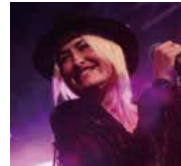
Sarah Connor, 2015 Mehr Infos zur Sängerin unter: www.sarah-connor.com

Der nächste KONFI-GOTTESDIENST: Buß- und Bettag, 18. 11. 2015, 19 Uhr