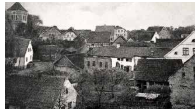
Postkarte der Stadt Nordenburg in Ostpreußen. Links oben der Turm der Ev. Luth. Kirche

An Haslach und im Kinzigtal gefallen mir die Landschaft, die Menschen an sich und ihre Tatkraft. An Weihnachten freue ich mich auf unser Familienfest mit meinen Kindern, Enkeln und Ur-enkeln. Zudem gefallen mir die traditionellen Haslacher Weihnachtslieder.