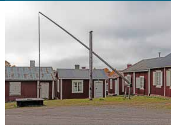
Holzhütten des Kirchdorfes und Kapelle.

https://de.wikipedia.org/wiki/Schwedische_Kirche https://www.svenskakyrkan.se/deutsch-tyska