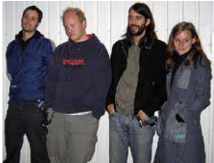
Wir sind Helden mit (von links): Mark Tavassol, Jean-Michel Tourette, Pola Roy und Judith Holofernes im Jahre 2005.

Die deutsche Pop- und Rockband „WIR SIND HELDEN“ war vor allem in den 2000er Jahren aktiv. Einer ihrer bekanntesten Songs inspirierte den Schwerpunkt des Gemeindebriefes: