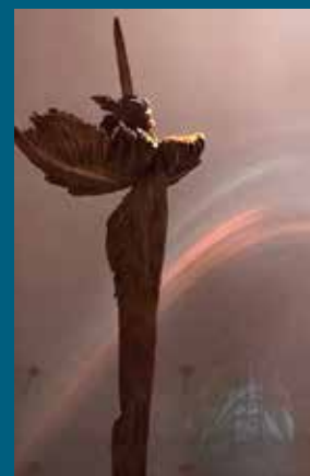
Farbenspiel des Holzengels in der Kirche

Pfr. Christian Meyer und der Kirchengemeinderat