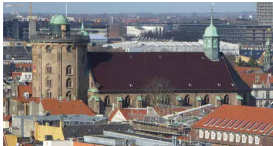
Die evangelisch-lutherische Dreifaltigkeitskirche (dänisch Trinitatis Kirke) am Landemærket im Stadtzentrum von Kopenhagen.

Ich freue mich immer auf Weihnachten. Besonders wichtig ist mir das Zusammensein in der Familie. Ich gehe gerne mit der Familie am Heiligen Abend in die Kirche. Wichtig ist mir ein Lied: „OH DU FRÖHLICHE“. In meiner Kindheit sang das unser Pfarrer besonders lautstark und überzeugend, fand ich immer toll!