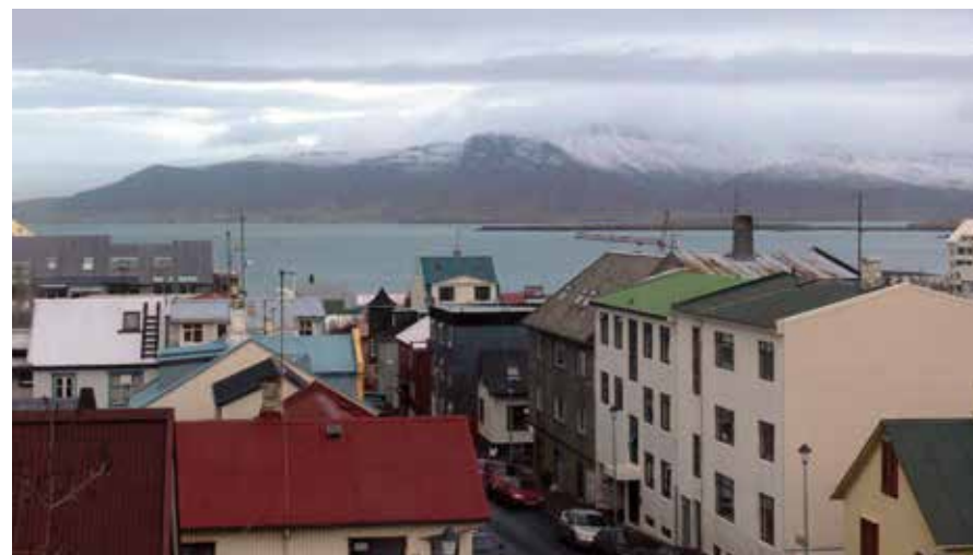
Foto: Blick auf die Meeresbucht von Reykjavik.

Die Kirche hat zwei Orgeln, darunter die größte Orgel von Island. Die Orgel wurde bei Johannes Klais in Bonn gebaut und im