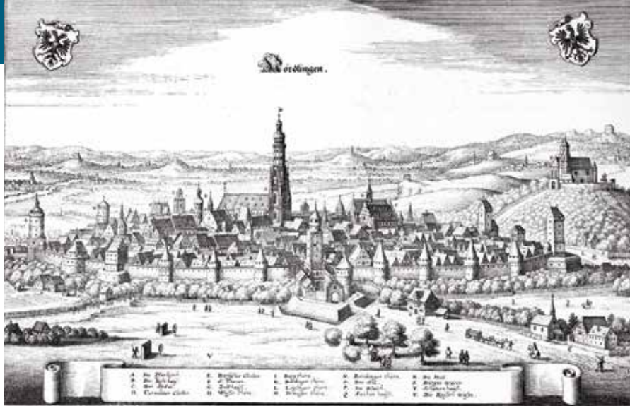
Blick auf das historische Nördlingen mit der lutherischen Kirche St. Georg (Kupferstich, 17. Jahrhundert)

Wittenberger um Luther und Melanchthon und die Schweizer um Zwingli, untragbar geworden.