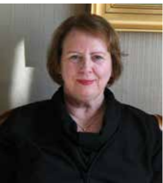
Bild links: Agnes Sigurðardóttir, Bischöfin der Evangelisch-lutherischen Kirche in Island.

Dezember 1992 eingeweiht. Die Orgel ist 15 Meter hoch und wiegt 25 Tonnen. Sie hat vier Manuale, ein Fußpedal, 72 Register und 5275 Pfeifen. Die längsten Pfeifen sind zehn Meter lang. Die Orgel wurde durch private Spenden finanziert. Die kleinere Orgel hat zehn Stimmen und wurde in Lynby in Dänemark (Frobenius-Organ) gebaut. Diese Orgel wurde im Dezember 1985 eingeweiht.