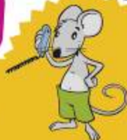
Illustration: Inge C.

Scherzfrage: Wo kommt Silvester vor Weihnachten? Im Korbhüch