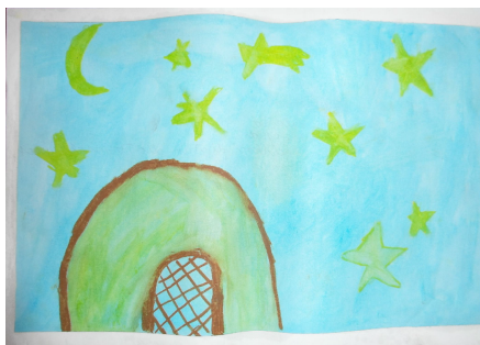
Valerio Zorzi, Haslach: Macht hoch die Tür

Fast 30 Kinder aus unserer Gemeinde nahmen im Religionsunterricht an der Malaktion zum Kirchenjahr teil. Thema der Bilder sind die Feste des Kirchenjahres. 4 Bilder, die zur Advents- und Weihnachtszeit passen, stellen wir hier vor. Danke an alle Kinder, Eltern und Lehrer, die mitgemacht haben.