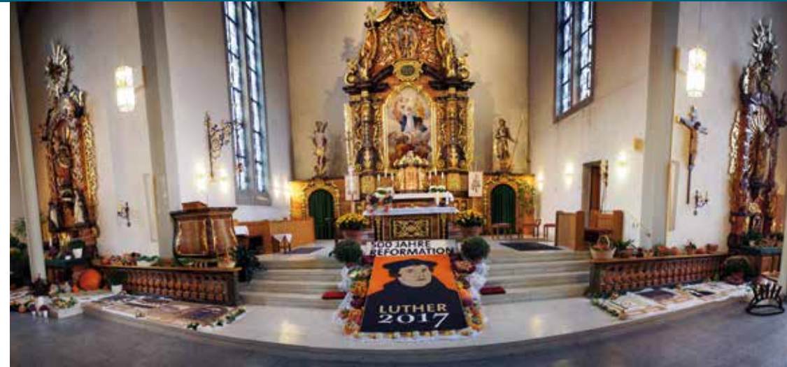
Der Reformator vor dem Altar der katholischen Kirche: Die Mühlenbacher Reformationsbilder aus Körnern und Samen zur Geschichte der Reformation.