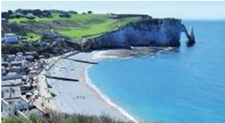
Der Strand von Etretat mit dem beliebten Felsvorsprung, genannt „Nadel“ („aiguille“).