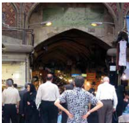
Ein Eingang zum großen Bazar von Teheran