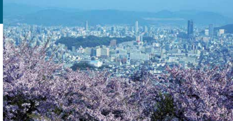
Blick vom Ogon-Gipfel auf die Bucht von Hiroshima. Im Hintergrund das Mazda-Werk und ein Frachter für den Export neu gebauter Fahrzeuge. Hier waren während des Ersten Weltkriegs deutsche Kriegsgefangene interniert. Sie haben unter anderem das Fußballspiel sowie den inzwischen äußerst beliebten Baumkuchen in Japan eingeführt.