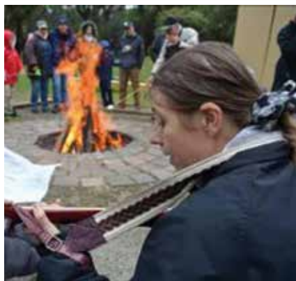
Foto oben: Skyline, Melbourne. Foto unten: Gottesdienst am Lagerfeuer.

Im Jahr des Reformationsjubiläums beschäftigte unsere Gemeinde nicht nur Themen der Reformation und unseres Glaubens sondern auch eigene interne Reformprozesse. Im Januar 2017 stellte unsere Gemeinde ihr neues Leitbild für den Zeitraum 2017-2021 vor. Und in den nächsten Wochen wird ein neuer Masterplan vorgestellt der zukünftig richtungsweisend sein wird für Bau- und Renovierungsarbeiten auf unserem Kirchengelände die unserem Leitbild und der verbesserten Verkündigung des Evangeliums dienen werden.