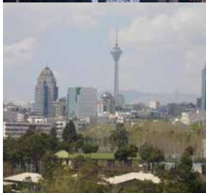
Skyline von Teheran. Die bei weitem wichtigste Einnahmequelle des Landes ist der Verkauf von Erdöl.