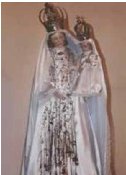
Marienstatue in der Kirche