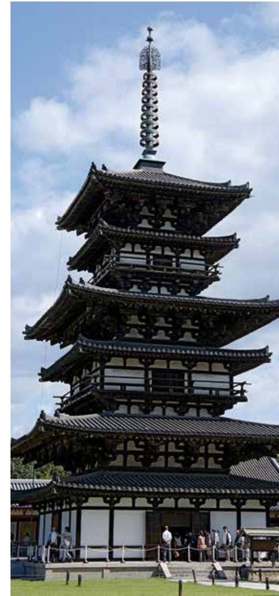
Buddhistischer Tempel in Japan.

Der Gottesdienst unterscheidet sich lediglich durch die Sprache von dem in einer deutschen Kirche. Während der Predigt betrachte ich Pfarrer Itō und fühle mich durch sein Äußeres, vor allem jedoch durch seine Gestik an den Vater meiner Gastfamilie erinnern, bei der ich 1995 vier