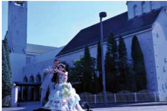
Brautpaar vor der St. Raphael Hochzeitskirche in Hiroshima.

Das mag zum einen daran liegen, dass ich einige Male von Freunden zu ihren Hochzeiten in ebensolche „Kirchen“ eingeladen wurde, zum andern aber am