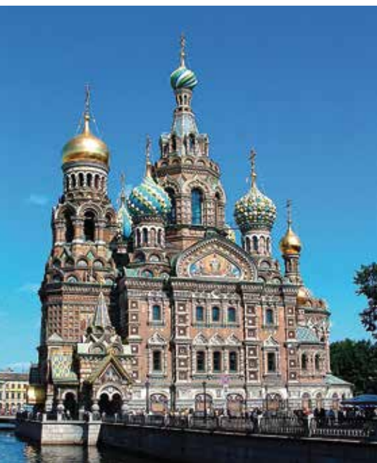
In St. Petersburg gibt es viele schöne Kirchen. Hier die russisch-orthodoxe Auferstehungs-Kathedrale.

Die kleine evangelische Kirche („Temple d'Etretat“) wurde 1883 auf Initiative des einflussreichen Pariser Pastors Auguste de Coppet und Jean-Daniel de Visme