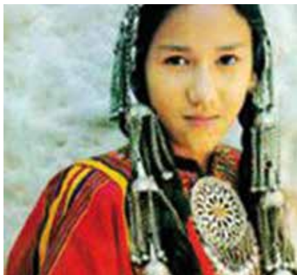
Turkmenin in Nationaltracht

www.turkmenistan.gov.tm/_eng/ de.wikipedia.org/wiki/Turkmenistan