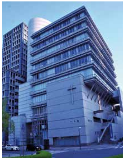
Die Ev.-Lutherische Kirche in Hiroshima.

Weder der Buddhismus noch der Shintoismus verbietet es seinen Gläubigen gleichzeitig andere Götter anzubeten. So sieht hier niemand einen Widerspruch darin, mit Neugeborenen zum Shinto Schrein zu gehen um deren Glück und Gesundheit zu erbeten, gleichzeitig aber die Verstorbenen nach buddhistischem