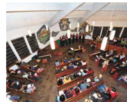
Gottesdienst in der Evangelischen Kirche.

Die 1962 eingeweihte Kirche mit sehenswerten Mosaiken befindet sich in zentraler Lage im schönen Stadtviertel Sopocachi. Alle zwei Wochen treffen sich Gemeindeglieder und Interessierte um 10:30 Uhr zum deutschsprachigen Gottesdienst und anschließendem Kaffeetrinken. Auch wer nicht evangelisch ist oder in Deutschland keiner Kirche angehörte ist hier herzlich willkommen! Einmal im Monat wird das Abendmahl gefeiert. Für Groß und Klein.