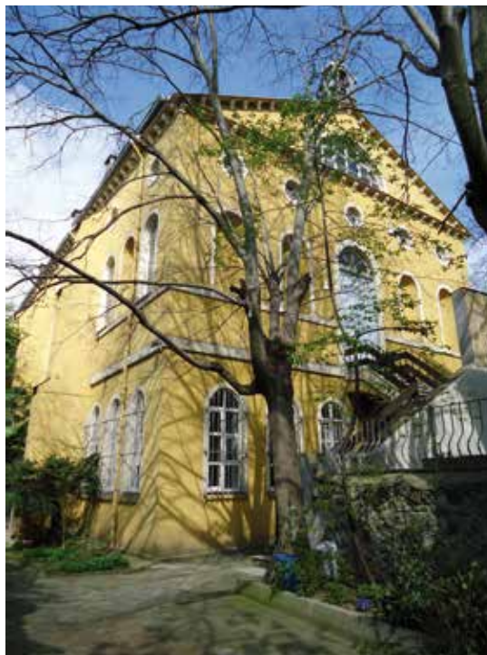
Die Kreuzkirche der Deutschen Evangelischen Gemeinde in Istanbul.

Bis heute liegt das Zentrum der Gemeinde aber mit der Kreuzkirche in Beyoğlu, es gibt aber auch Filialgemeinden z.B. in Ankara, Bursa und Izmir. In Istanbul findet sonntäglich Gottesdienst statt, hier tref-