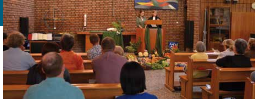
Die Deutsche Kirche in Teheran von innen.