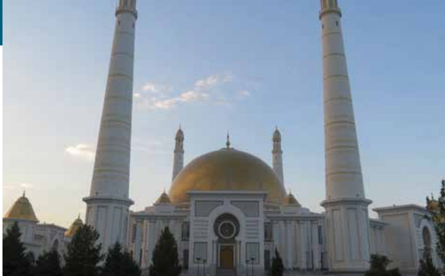
Die größte Moschee Asiens in Ashgabat, der Hauptstadt Turkmenistans.

um gefeiert. Das Land ist sehr stolz auf seine Neutralität und bezeichnet sich gerne als „die Schweiz Asiens“. Die einheimischen Menschen sind alle muslimischen Glaubens. Am vergangenen Sonntag habe ich in der Hauptstadt Ashgabat die größte Moschee, ein Wahrzeichen des Landes, besucht. Es handelt sich sogar ganz offiziell um die größte Moschee von ganz Asien. Sie bietet sage und schreibe 15.000 Gläubigen Platz und ist rund um die Uhr geöffnet.