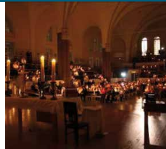
Weihnachtsgottesdienst 2015 in der deutschen evangelisch-lutherischen Gemeinde in St. Petersburg.

Die evangelisch-lutherische Gemeinde mit ihren etwa 300 Mitgliedern hat das kirchliche Leben wieder aufgenommen. Jeden Sonntag um 10:30 Uhr beginnt der Gottesdienst in der Petrikerche. Die St. Annen und St. Petrigemeinde veranstaltet mit der zu Pfingsten 2017 eingebauten großen Orgel Willy Peter die Orgel- und auch andere Konzerte und nimmt an verschiedenen Wohltätigkeitsprojekten aktiv teil. Darüber hinaus pflegt sie ei-