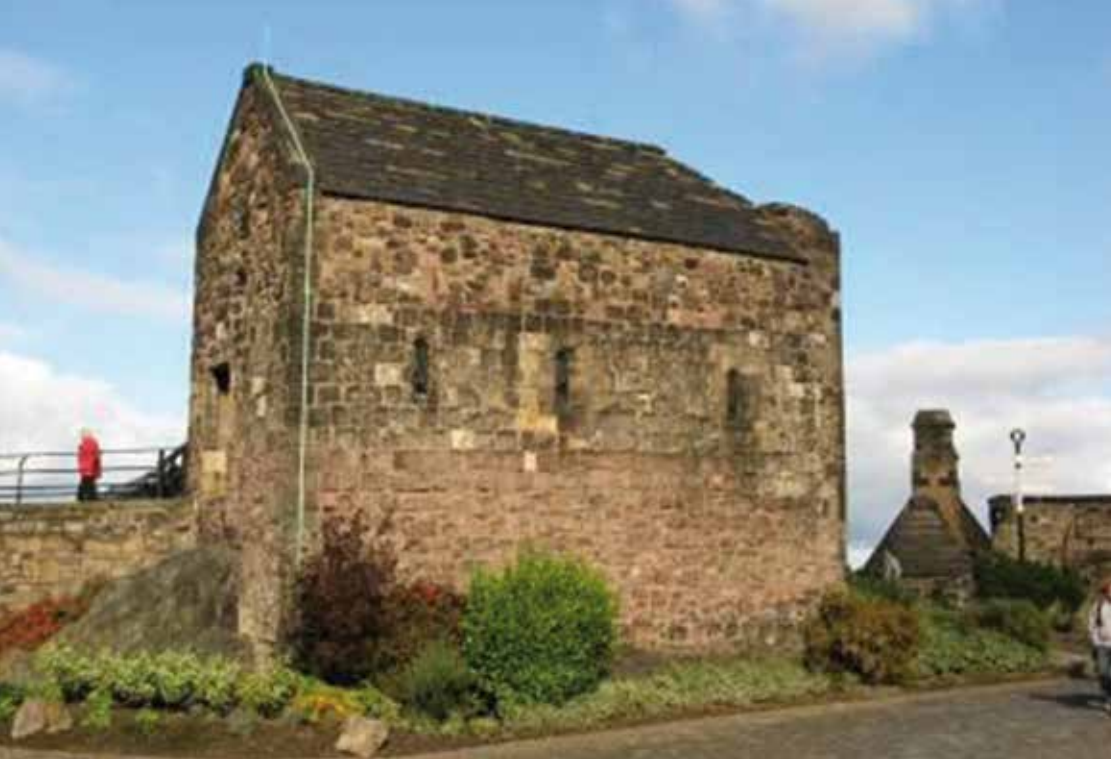
Die St. Mary's Kapelle in Edinburgh