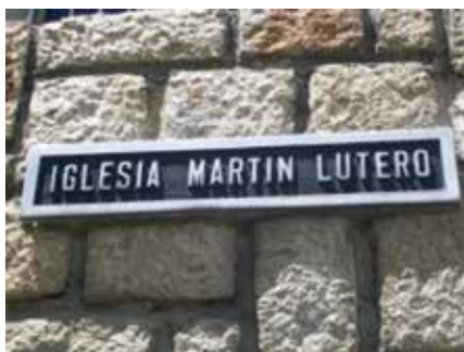
Schild an der Mauer der Kirche.