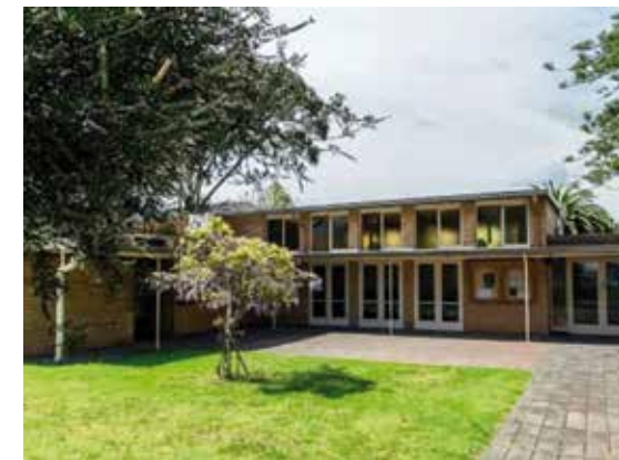
Die Kirche mit dem Innenhof.

Love God, love one another, make a difference - Gott lieben, einander lieben und einen Unterschied machen. Mit diesem Leitwort gestaltet unsere Gemeinde ihre Verkündigung des Evangeliums von Jesus durch Gottesdienste und geistliche Angebote. In unseren Zusammenkünften im Seniorenkreis oder in Spielgruppen. Unsere Outreachprojekte hin zu der deutschen und englischen Öffentlichkeit