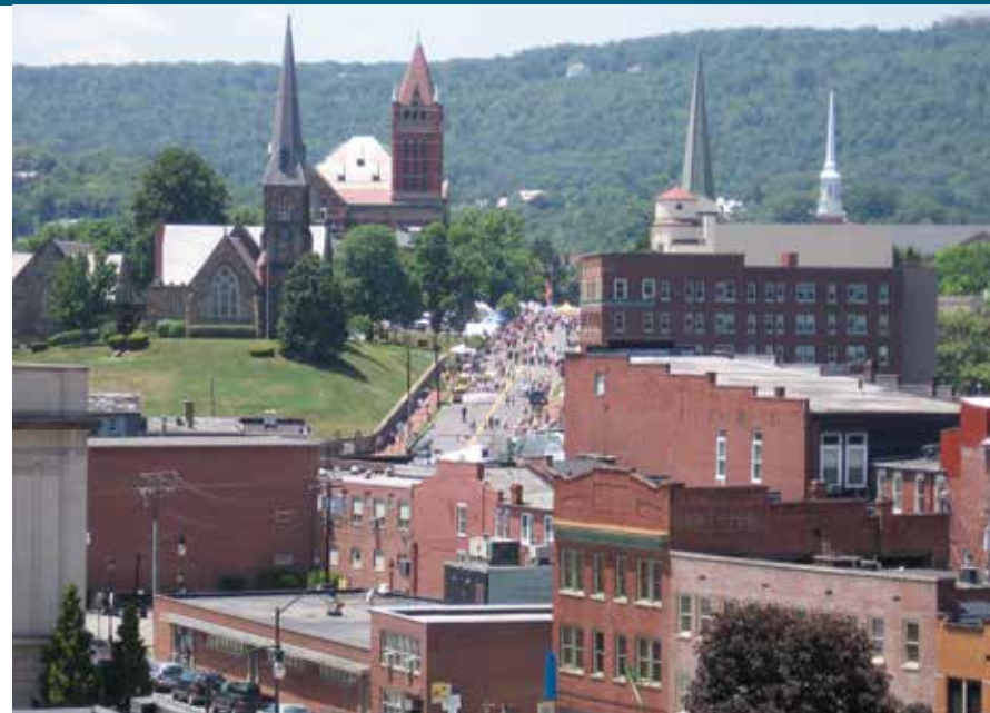
„Schwarzwaldfeeling“ in den USA: Blick auf die Kleinstadt Cumberland.

Jetzt bin ich 85 geworden. Ich kann nicht gut sehen, gehen, oder hören, aber trotz allem, hat Gott mir in seiner Barmherzigkeit erlaubt, noch einmal mein geliebtes „Hasle“ zu besuchen. Mein Enkelkind wird mich fahren und betreuen. Ein 25ziger und ein 85ziger reisen zusammen: Das beweist, dass Gott